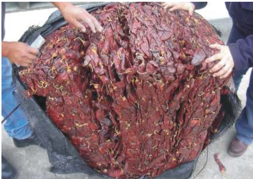
Monitoreo de exportación-despacho