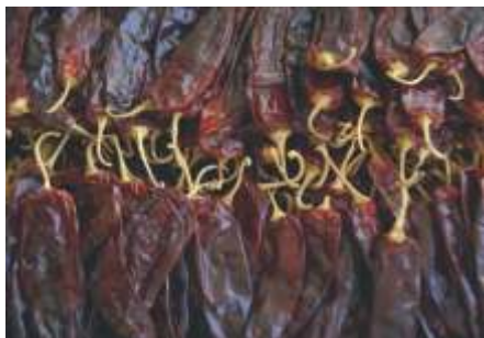
Páprika de mesa