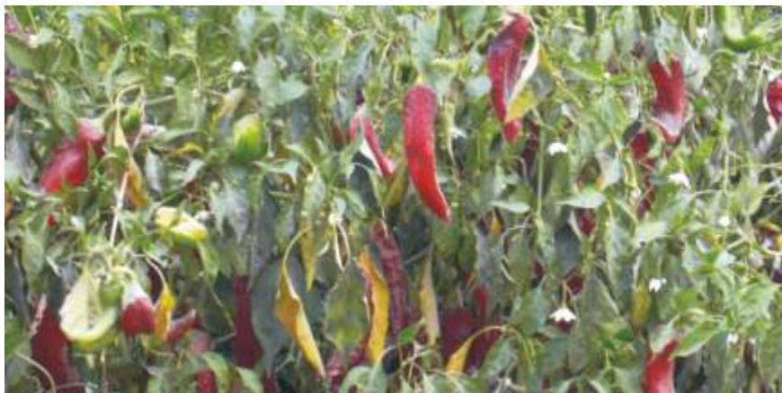
Campo a cosechar con frutos enfermos (caso 1)