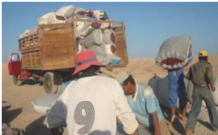
Transporte de páprika en sacos

El transporte debe tener tratamiento de limpieza y desinfección ya que estará en contacto con el producto.