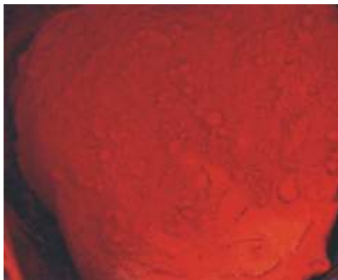
Harina de Ají Paprika