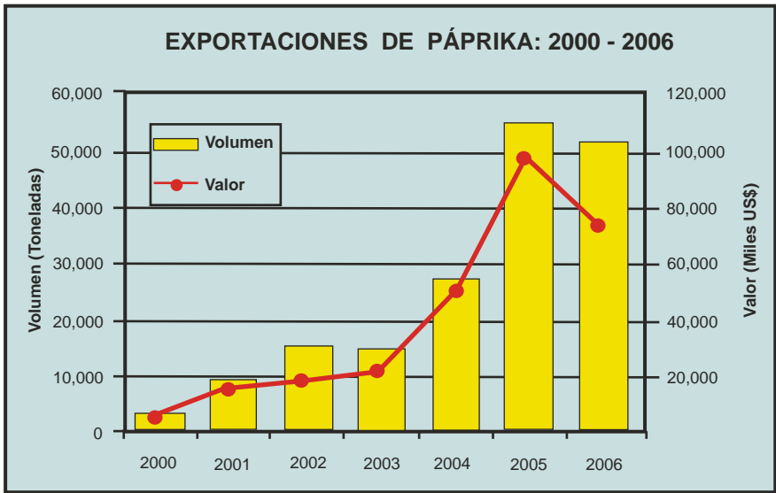
Gr fico N  3

(RPP Noticias) Refirió que la calidad de nuestra p prika hace que sea muy demandada, pero a n falta trabajar para hacerla m s conocida y afianzar la imagen del Per  como un pa s exportador de ese producto.