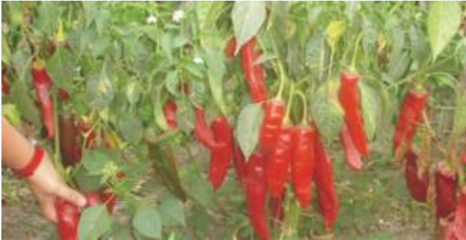
Campo a cosechar con frutos buenos y homogneos (caso 2)

Si la evaluación de campo es de un pprika de tamao uniforme, color homogneo, buen rendimiento y cultivo saludable, nos va a indicar que la produccin va a estar destinada a la comercializacin y produccin de pprika entero, sea en mesa (cajas), o pacas (fardos), estos nos indica un mayor cuidado higinico desde la cosecha, capacitacin del personal, buen tratamiento a la era de deshidratado, buena clasificacin de pprikas no aptos para la elaboracin de este producto.