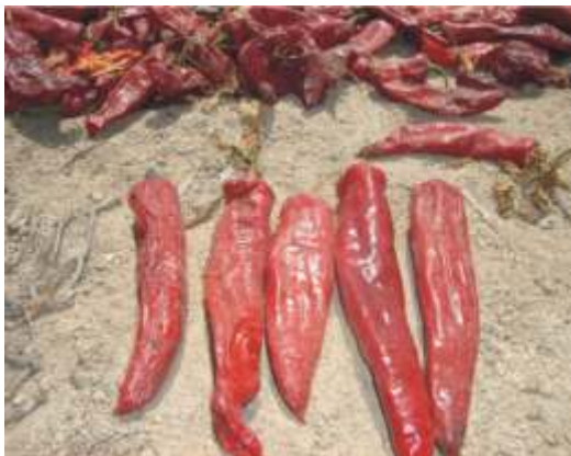
Producto garantizado (ms ventas)