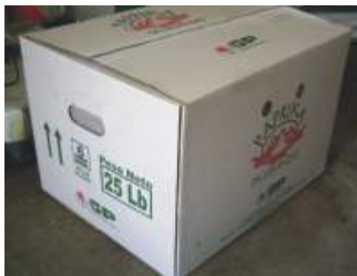
Caja embalada con producto terminado