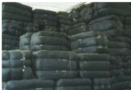
Almacén de pacas de 100 kilos c/u